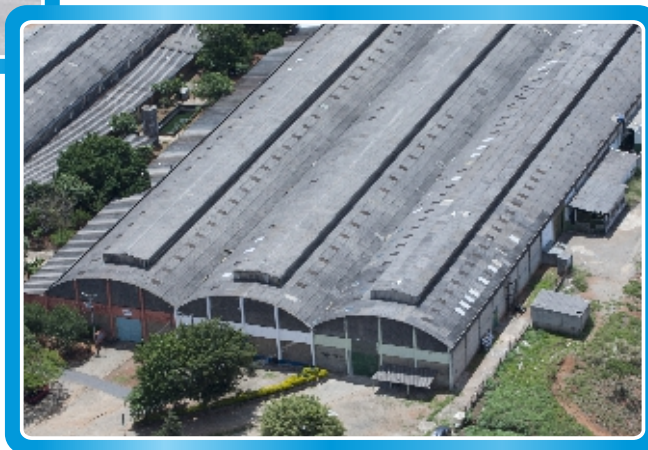
Unidade de Apoio e Logística - Bragança Paulista - SP