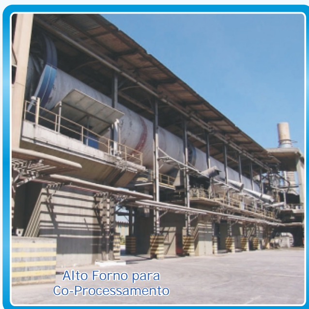
Alto Forno para Co-Processamento