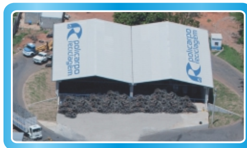
Unidade 02 - Cezarina - GO