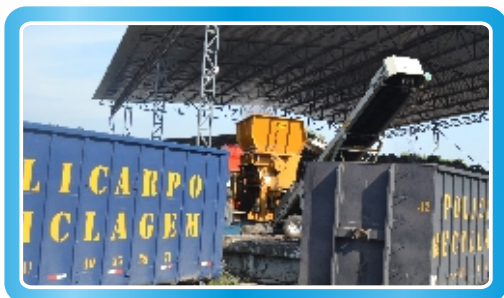
Unidade 03 - Rio de Janeiro - RJ