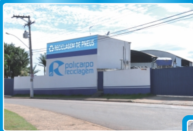
Unidade 01 - Bragança Paulista - SP